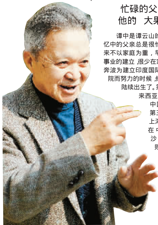
谭中老人在接受记者专访

印度国际大学中国学院首任院长。现代印度中国研究的奠基人。他与周恩来、蔡元培、泰戈尔、尼赫鲁、甘地等人建立了亲密友谊,并在特殊的时代背景下,谭云山还为中国抗战、为反法西斯战争奔走辛劳,作出了巨大贡献。1956年、1959年,应国务院特别邀请,谭云山先生两度回国,受到党和国家领导人毛泽东、刘少奇、周恩来的接见。1968年,谭云山被印度国际大学中国学院授予“终身名誉教授”。1979年又被该校授予最高荣誉——文学博士。1983年2月12日谭云山在印度菩提伽耶住所病逝,终年85岁。印度总理英·甘地夫人称赞他“是一位伟大的学者,一位真正有文化素养的人”。